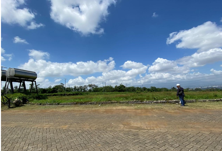
Gambar 2. 2 Foto Lokasi Perencanaan Pembangunan Perumahan

Luas perumahan Kawasan New City ini sekitar 150 hektar. Disana juga sudah terbentuk lingkungan perumahan yang sudah berjalan lama. Pada Kawasan New City ini memiliki fasilitas umum seperti masjid, jalan utama, Taman Kanak-kanak, dll. Di dalam Kawasan New City ini juga ada lahan kosong sekitar 2 hektar. Pada lahan tersebut kami merencanakan pembangunan perumahan,