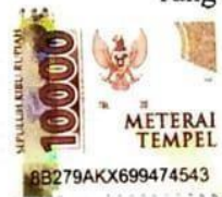
(Nanda Imroatus Sholikhah )