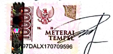
Arkham Al Husaini