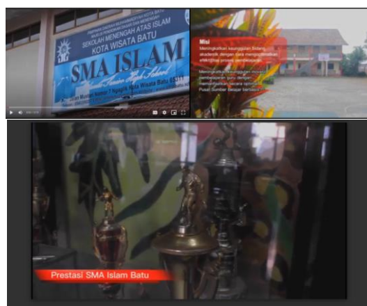
Gambar 1. Video Profil sekolah

Evaluasi dari kegiatan pengabdian masyarakat dilakukan secara bertahap, yaitu saat pelaksanaan berlangsung dan setelah kegiatan. Evaluasi dilakukan secara berkala untuk melihat hasil dari kegiatan yang sudah dilakukan. Keberlanjutan program dapat dilihat dari langkah tindak lanjut. Hasil dari media sosial sekolah dapat dilihat melalui IG atau website sekolah