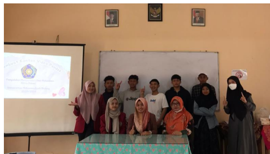
Gambar 1. Kegiatan Workshop CapCut

untuk melakukan promosi keluar, baik itu untuk siswa maupun pihak lain. Pada video profil terdapat visi misi sekolah, fasilitas sekolah dan prestasi.