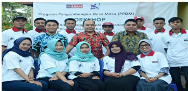
Gambar 2. Tim pengabdian berfoto bersama para peserta kelas literasi kopi pasca briefing untuk persiapan kelas tanggal 2 Agustus 2019

sepakati bahwa kelas akan dimulai dari tanggal 2 Agustus 2019 sampai dengan tanggal 13 Agustus 2019. Berikut adalah merupakan dokumentasi pertemuan kami dengan para peserta kelas literasi kopi di Desa Amadanom