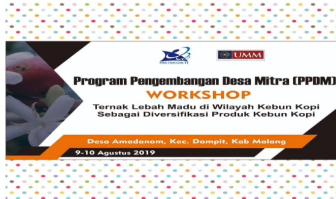
Gambar 4. Banner workshop ternak lebah madu di Desa Amadanom

perkembangan bisnis kopi mereka. Berikut ini adalah dokumentasi kelas literasi kopi dengan topik digital marketing.