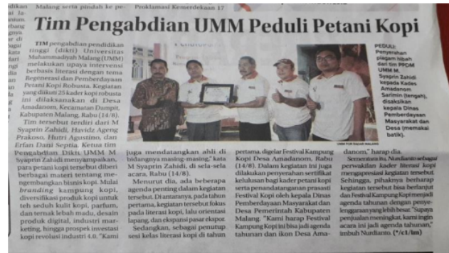
Gambar 9. Acara Festival Kopi dimuat oleh harin Radar Malang pada tanggal 16 Agustus 2019.

Kelas literasi kopi dan festival kopi ini pada akhirnya memiliki pengaruh besar pada animo masyarakat terutama generasi muda di Desa Amadanom untuk melanjutkan profesi orang tuanya. Hal ini menurut kami sangat bermanfaat karena produk kopi robusta dari Desa Amadanom akhirnya akan tetap terjaga karena sudah ada generasi-generasi muda yang berkomitmen untuk melestarikannya.