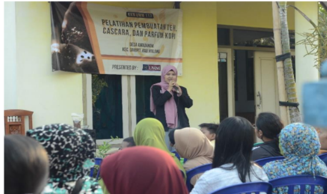
Gambar 3. Tampak dalam gambar pembicara dari peserta KKN di Desa Amadanom dalam workshop value added kopi robusta pada tanggal 3 Agustus 2019

materi tentang value added kopi robusta amadanom menjadi produk Cascara (Teh Kopi) dan produk Parfum (Absorb Power) dalam kelas ini kami melibatkan mahasiswa-mahasiswa yang sedang melaksanakan KKN di Desa Amadanom untuk memberikan materi tentang topik ini karena ada beberapa mahasiswa di kelompok KKN tersebut yang juga memiliki pengalaman dalam diversifikasi produk kopi. Harapan kami dengan adanya pembekalan diversifikasi produk kopi maka para petani kopi di Desa Amadanom akhirnya akan memiliki keterampilan baru selain hanya menanam pohon kopi. Berikut adalah dokumentasi dari kelas value added tersebut.