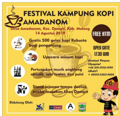
Gambar 7. Poster Acara Festival Kopi Di Desa Amadanom

Materi dari Bapak Fuad Nasvian tersebut menjadi materi terakhir dalam kelas literasi kopi pada program pengabdian kami. Setelah kelas literasi kopi maka kami mengadakan festival kopi di Desa Amadanom. Harapan kami dengan adanya festival kopi di Desa Amadanom maka ini akan mejadi festival yang rutin dilakukan minimal setahun sekali dan hal ini telah disetujui oleh kepala Desa Amadanom yaitu Bapak Sarimin. Gambar-gambar berikut ini akan menunjukkan kegiatan-kegiatan yang kami lakukan dalam festival kopi di Desa Amadanom.