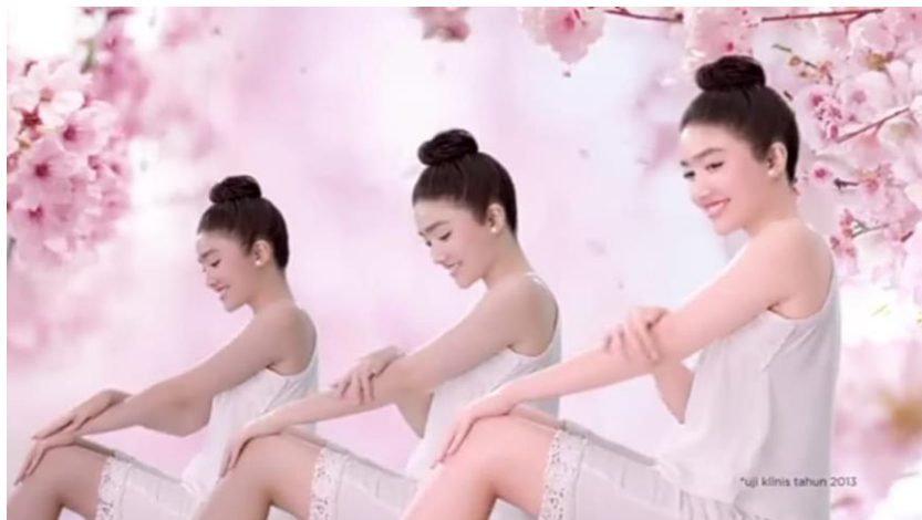
Gambar 1.7 Iklan Body Lotion Citra "Sakura Fair UV"