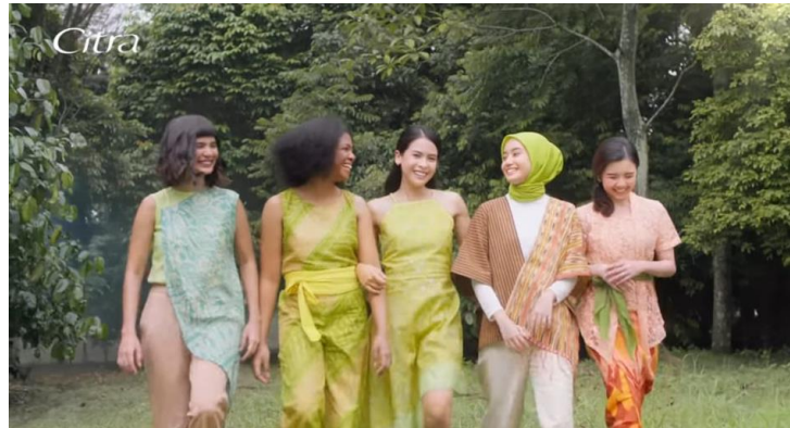
Gambar 1.4 Iklan “Ragam cantik Indonesia Citra” Tahun 2022