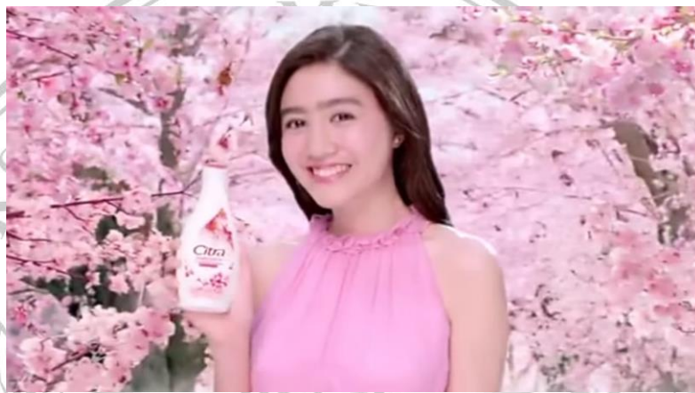
Gambar 1.6 Iklan Body Lotion Citra "Sakura Fair UV"

Mengambil momentum dimana publik mulai terbuka pemikirannya dengan bagaimana bisa saling menghargai perbedaan dan bangga dengan perbedaan itu sendiri, produk Citra menjadi salah satu produk kecantikan yang melakukan reformasi dan dengan cepat merubah image produknya dengan lebih humanis, lokalitas, serta menjunjung tinggi perbedaan. Meski sebelumnya iklan-iklan yang ditawarkan masih pada formula yang sama seperti produk kecantikan lain. Mengutamakan image wanita cantik yang menjadi standar iklan kecantikan.