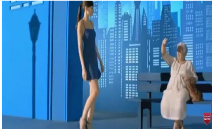
Gambar 1.2 Iklan Hanbody Vaseline