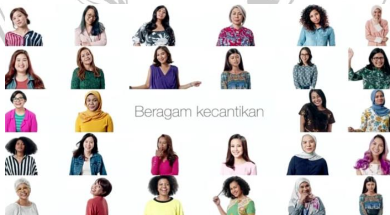
Gambar 1.3 Iklan dan Campaign Dove

Namun seiring dengan dinamisnya pemahaman akan kebebasan berekspresi, kesetaraan gender dan isu body shaming , media sosial dan televisi mulai menggalakkan akan keberagaman kriteria dan standar kecantikan yang ada di Indonesia, di era media sosial, khalayak lebih beragam segmentasinya sehingga penerimaannya pun juga beragam. Sudah meleak akan adanya perbedaan dan keunikan khususnya konsep cantik dari ragam daerah, ras dan suku di Indonesia. Iklan produk kecantikan juga akhirnya merangkul model iklan yang tidak hanya putih, tinggi langsing, hidung mancung, rambut lurus. Tetapi juga model mengkontruksikan cantik sesuai dengan standar cantik lokalitas di Indonesia.