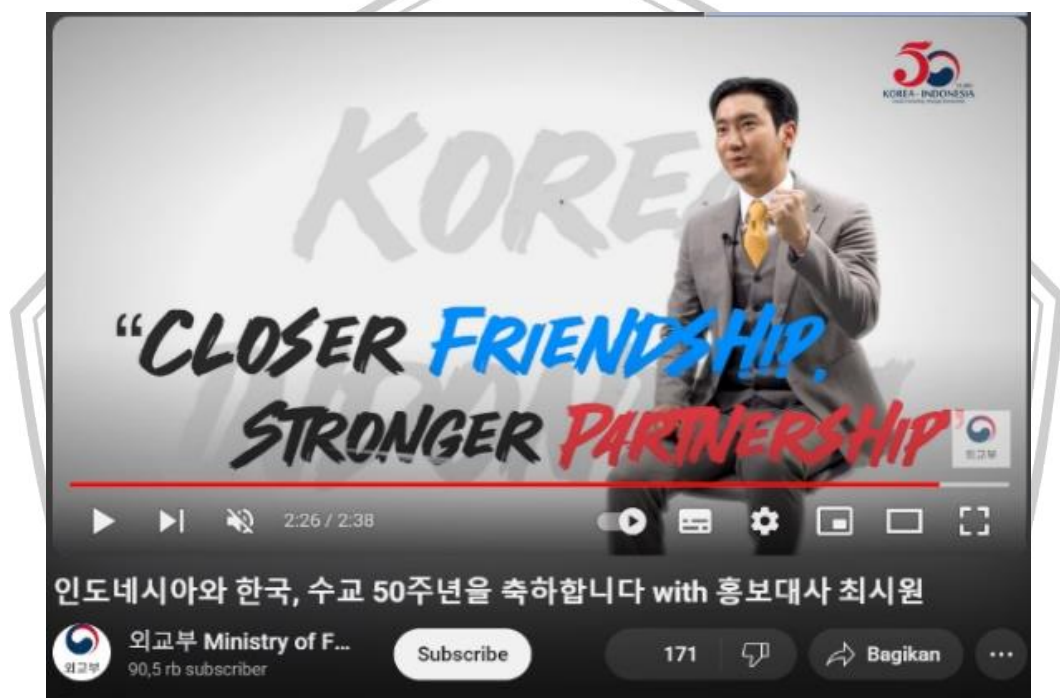
Gambar 3. 3 Video Choi Siwon Sebagai Duta Promosi Korea Selatan Dalam Rangka Perayaan Hubungan Diplomatik Indonesia-Korea Selatan Yang ke-50 Tahun 2023