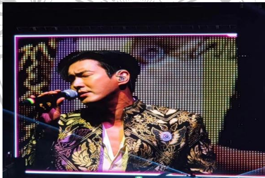
Gambar 3. 6 Choi Siwon Mengenakan Kemeja Batik Pada Saat Konser “Super Junior World Tour - Super Show 9 Roadshow” di Jamsil Arena Seoul

saja penampilan Choi Siwon mengenakan kemeja batik pada saat konser di Korea Selatan membuat para penggemar terpujau akan penampilannya. Selain memakai kemeja batik, Choi Siwon juga mengenakan pin ber lambang “perayaan hubungan diplomatik Indonesia-Korea Selatan yang ke-50 tahun”. Kemeja batik yang dikenakan oleh Choi Siwon merupakan Batik Indonesia Pusaka yang memiliki motif bunga dengan daun-daun emas. Kemeja batik yang dipakai Choi Siwon pada saat konser di Korea Selatan mengejutkan Dubes Indonesia sekaligus Anne Avantie selaku desainer kemeja batik yang dikenakan oleh Choi Siwon. 97