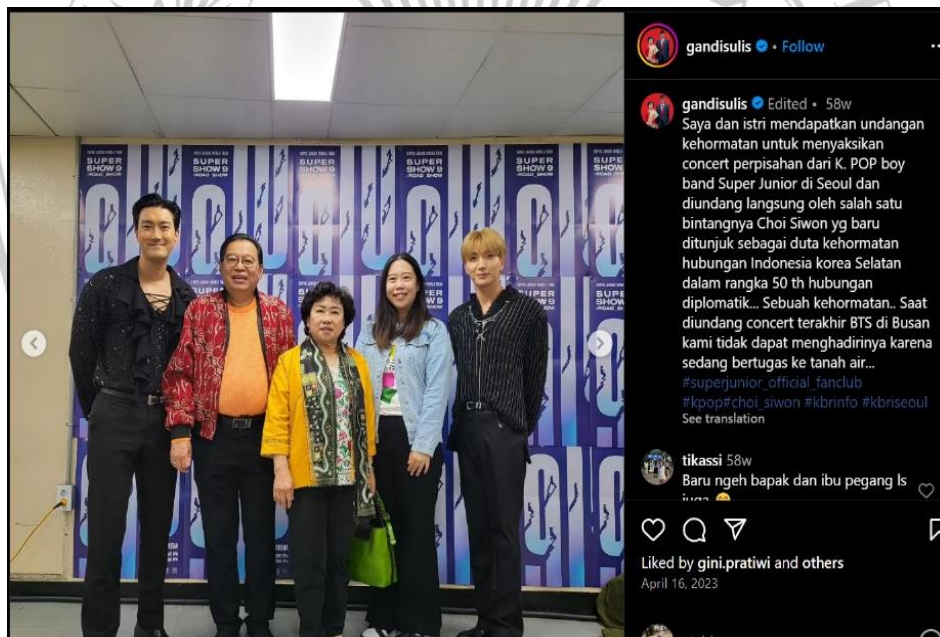
Gambar 3. 7 Bapak Gandhi dan Istri Foto Bersama Dengan Choi Siwon dan Leeteuk Super Junior Di Belakang Panggung

Tindakan Choi Siwon ini juga merupakan cara untuk menjembatani hubungan publik Indonesia-Korea Selatan. 98 Selain itu, tindakan yang dilakukan Choi Siwon pada saat konser dengan menggunakan kemeja batik membuat penggemar Super Junior dari Indonesia merasa bangga karena idolanya, Choi Siwon mengenakan kemeja batik dari Indonesia. Bahkan beberapa penggemar mengucapkan terimakasih kepada Anne Avantie selaku desainer kemeja batik karena telah membuat kemeja batik yang bagus untuk Choi Siwon. 99