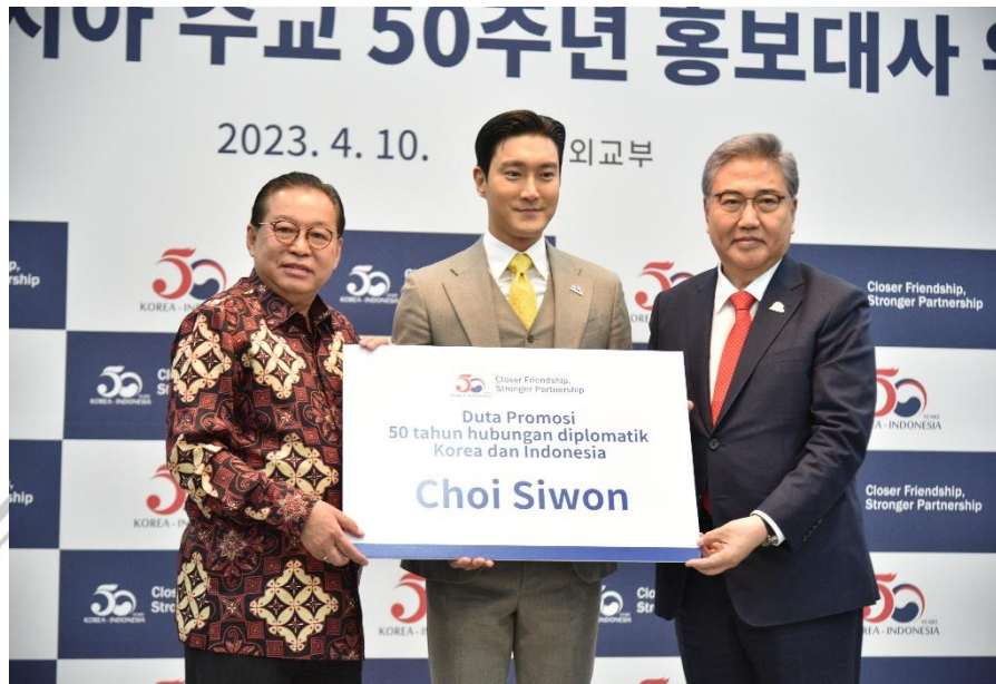
Gambar 3. 1 Penunjukkan Choi Siwon Sebagai Duta Promosi 50 Tahun Hubungan Diplomatik Korea dan Indonesia Pada 10 April 2023