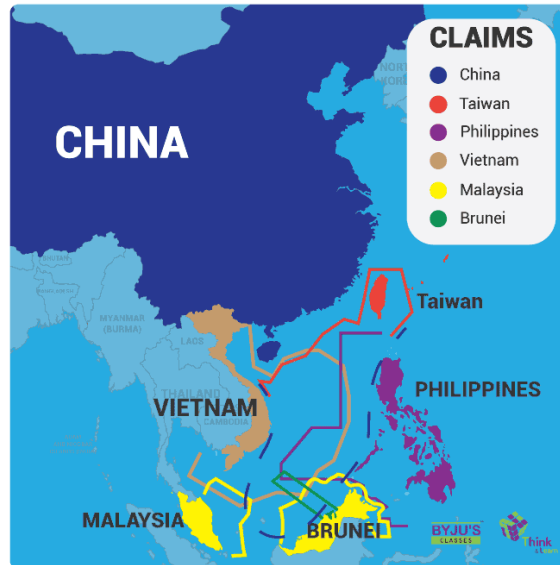
Gambar 2. 1 Peta Klaim Kepemilikan Wilayah Laut China Selatan