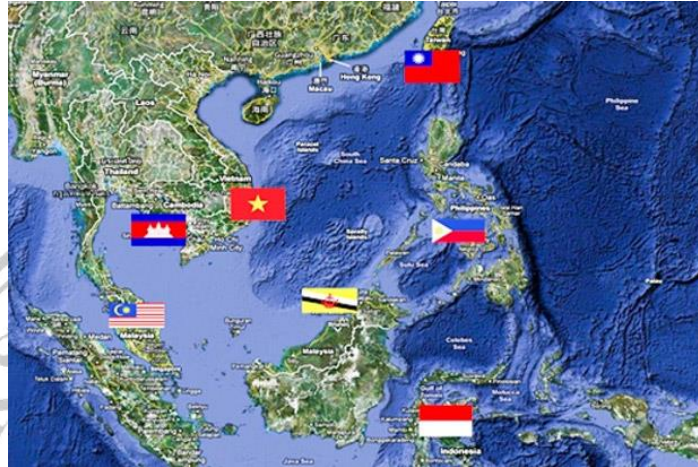
Gambar 2. 2 Peta Laut China Selatan