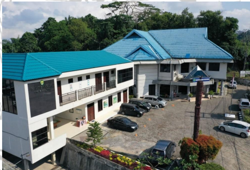
Gambar 3. 2 Kantor BALITBANGDA Provinsi Kalimantan Timur

Hal ini dimaksudkan dengan melakukan kajian dan investigasi mendalam terhadap aspek sosial, ekonomi, dan sosial. permasalahan politik yang dihadapi Provinsi Kalimantan Timur, hambatan-hambatan ini akan dapat diatasi secara lebih efektif di masa depan.