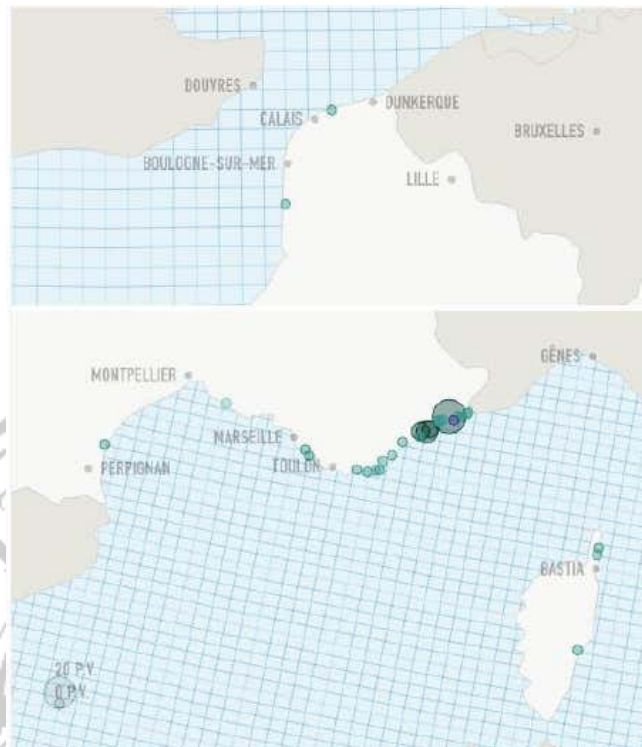
Gambar 3.2 Peta yang Menunjukkan 31 Kota Memberlakukan Larangan Burkini dan Kota-Kota Lain yang Memberikan Tiket Resmi untuk Pelanggaran