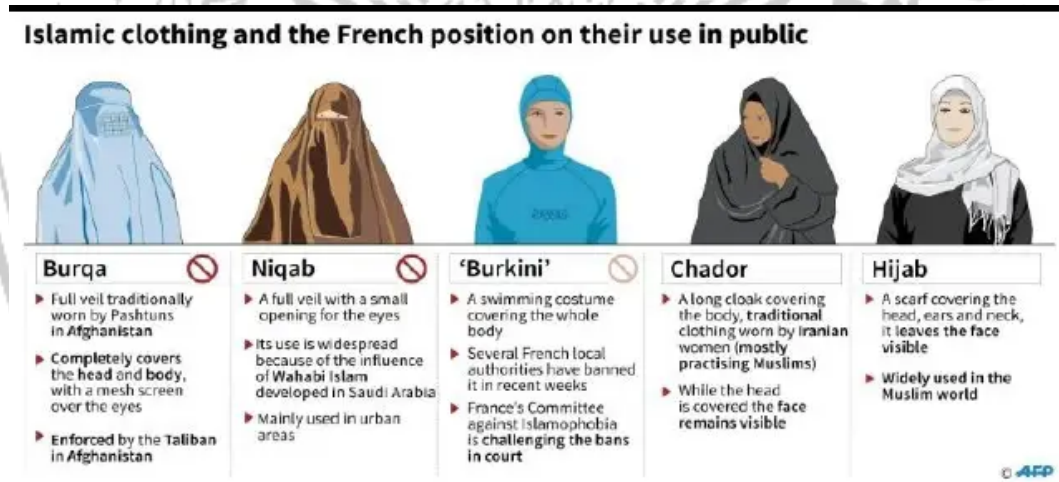
Gambar 3.1 Kebijakan Perancis tentang Pakaian Islami di Depan Umum

seperti penggunaan hijab. Sebelumnya pada tahun 2004 juga terdapat larangan penggunaan burqa dan niqab. Dan setelah disahkannya RUU oleh anggota dewan pada tahun 2011 terkait pelarangan ini menjadikan Perancis sebagai negara Eropa yang pertama memberlakukan pelarangan pemakaian cadar sebagai penutup wajah di tempat umum. 84 Pelarangan menutup wajah tersebut diberlakukan karena munculnya anggapan bahwa atribut ini bisa menghambat proses pertukaran informasi yang dilakukan secara langsung dan dipandang tidak selaras dengan nilai-nilai dari negara Perancis. Berikut merupakan pakaian wanita muslim yang sebelumnya dilarang untuk dipergunakan di ruang publik. 85