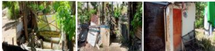
Gambar 3. 53 Kondisi Pengelolaan Air Limbah Desa Wringin Anom

Keadaan pengelolaan air limbah di Desa Wringin Anom mayoritas memiliki MCK pribadi dan telah terhubung dengan tangki septic, namun memiliki beberapa permasalahan, seperti limbah rumah tangga yang masih dibuang langsung ke saluran atau sungai tanpa diproses terlebih dahulu. Hal ini dikarenakan kemiskinan masyarakat dan rendahnya kesadaran pentingnya menjaga kesehatan.