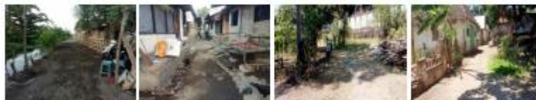
Gambar 3. 50 Kondisi Jalan Lingkungan Desa Wringin Anom

Keadaan jalan lingkungan di Desa Wringin Anom mayoritas permukiman sudah terkoneksi oleh jaringan jalan, namun memiliki beberapa permasalahan antara lain jalan aspal tetapi sudah mengalami kerusakan dengan kondisi sedang. Selain itu, adanya jalan yang masih belum terbangun berupa makadam maupun tanah dan Jalan Rusak karena faktor usia