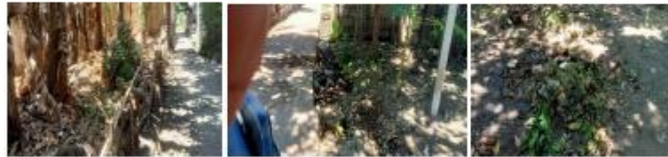
Gambar 3. 54 Kondisi Pengelolaan Sampah Desa Wringin Anom

Hal ini mengakibatkan sampah tidak terangkut dan terkelola dengan baik, sampah di kelola sendiri oleh masyarakat dengan cara dibuang ke sungai dan dibakar di lahan kosong.