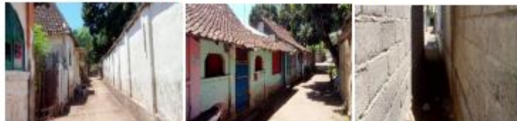
Gambar 3. 55 Kondisi Proteksi Kebakaran Desa Wringin Anom

Keadaan pengamanan bahaya kebakaran di Desa Wringin Anom memiliki beberapa permasalahan, seperti ketidakterediaan sistem pengamanan bahaya kebakaran secara aktif dan pasif yang dapat dilihat dari lingkungan atau setiap bangunan hnian yang tidak memiliki pengamanan bahaya kebakaran. Disamping itu, juga terdapat ketidakterediaan akses untuk mobil pemadam kebakaran karena masih ada beberapa jalan lingkungan yang ada memiliki lebar kurang dari 1,5 meter sehingga tidak dapat dilalui oleh mobil kebakaran.