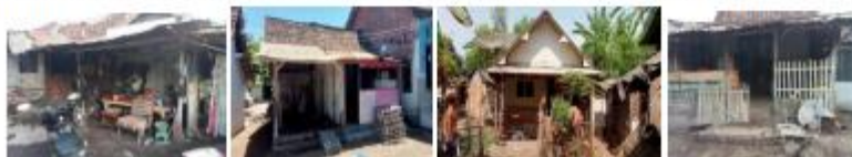
Gambar 3. 49 Kondisi Bangunan Hunian Desa Wringin Anom

Keadaan bangunan hunian di Desa Wringin Anom Mayoritas bangunan hunian adalah bangunan permanen dan milik pribadi. Bangunan hunian di permukiman kumuh Desa Wringin Anom memiliki beberapa permasalahan antara lain terdapat beberapa RTLH yang menggunakan material bangunan dinding dari kayu, triplek, bambu dan berlantai tanah. Kondisi ini disebabkan karena kemiskinan masyarakat mata pencaharian penduduk mayoritas buruh tani. Berikut adalah gambaran kondisi bangunan hunian di Desa Wringin Anom: