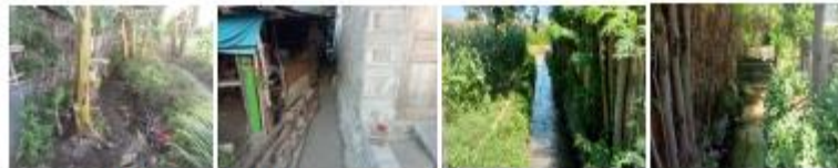
Gambar 3. 52 Kondisi Drainase Lingkungan Desa Wringin Anom

Keadaan drainase lingkungan di Desa Wringin Anom mayoritas telah memiliki drainase di tiap ruas jalan, namun memiliki beberapa permasalahan seperti pembuangan air limbah rumah tangga sehingga fungsi saluran drainase bercampur yang mengakibatkan pendangkalan saluran. Selain itu, adanya ketidakterhubungan saluran drainase dengan sistem drainase perkotaan sehingga tidak ada integrasi antara saluran drainase lingkungan dengan saluran drainase primer, sungai sebagai drainase utama tidak dapat menampung air hujan sehingga meluap ke permukiman warga