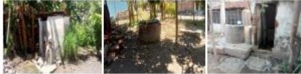
Gambar 3. 51 Kondisi Penyediaan Air Minum Desa Wringin Anom Sumber : Survey Lapangan, 2022

pembuangan limbah umumnya berjarak kurang dari 10 meter. Selain itu masyarakat tidak mampu mengakses PDAM karena dianggap terlalu mahal.