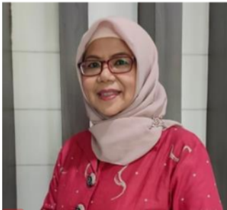
13 Dosen Pendidikan Bahasa Indonesia, Kepala Lembaga Kebudayaan, Universitas Muhammadiyah Malang