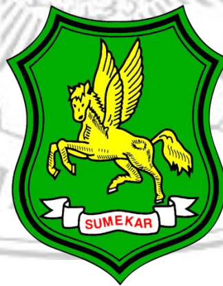
Gambar 3.1. Logo Kabupaten Sumenep

Salah satu julukan Kabupaten Sumenep adalah Bumi Sumekar, kata tersebut merupakan akronim dari Keraton Sumenep. Adanya julukan tersebut dikarenakan banyaknya keraton atau istana yang ada di Sumenep. Keraton atau istana di Kabupaten Sumenep merupakan pusat pemerintahan yang menjadi tempat tinggal para Adipati Sumenep pada zaman dahulu. Selain julukan, Sumenep juga memiliki tagline yang menjadi branding dalam melakukan kampanye kota, yaitu "Sumenep The Soul Of Madura". Tagline tersebut lahir karena Sumenep dianggap sebagai cerminan Pulau Madura secara umum, baik secara agama, budaya, maupun alamnya.