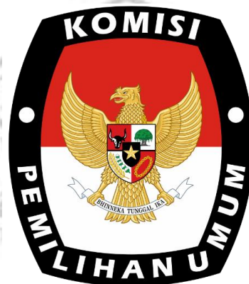
Gambar 3.3 Logo KPU

rencana, pengelolaan data, dan program, anggaran, dan informasi dalam lingkungan KPU yang dipimpin oleh Irfan Darmawan, S.I.Kom., M.IP. Keempat , Subbagian hukum dan SDM dengan tugas untuk menganalisis persiapan, pelaksanaan penyusunan dan kajian produk hukum, dokumentasi informasi, pemberian advokasi dan pendapat, fasilitas selesainya sengketa pemilu dan pemilihan, serta SDM yang dikelola pada lingkungan KPU yang dikepalai Budhie Kriswanto, S. Sos.