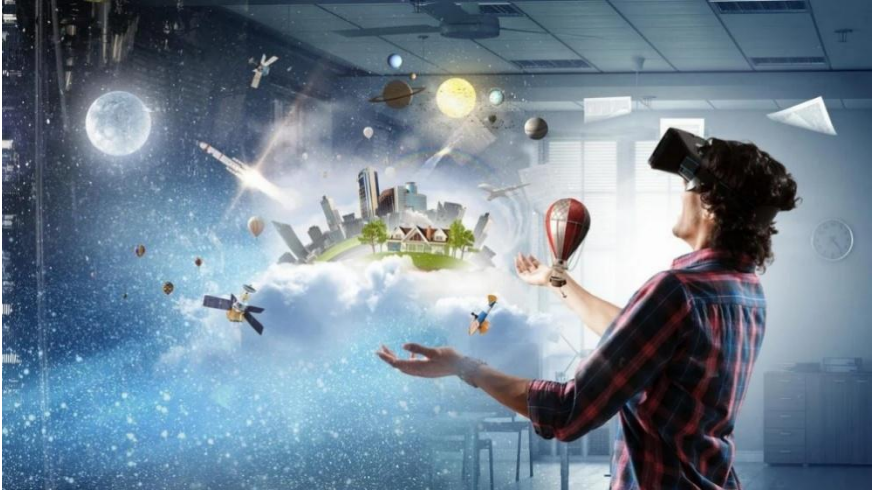
Gambar 4.3. Contoh VR yang digunakan seseorang untuk simulasi kedirgantaraan dan tata surya.