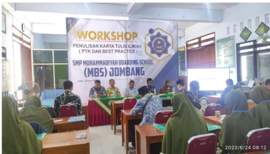
Gambar 2. Pelatihan Penelitian dan Publikasi

Setelah tercapai kesepakatan mengenai waktu dan teknis kegiatan, maka kegiatan pertama yang akan dilakukan adalah pelatihan pemdampingan bagi guru-guru. Kegiatan pelatihan dilakukan dengan harapan bahwa semua guru bisa terlibat dalam kegiatan ini karena semua guru memiliki potensi untuk menjadi peneliti dan penulis. Kegiatan ini diikuti oleh semua guru dari awal acara hingga penutupan (25 orang guru). Dengan demikian, persentase kepesertaan adalah 100%. Dokumentasi kegiatan ini disajikan pada Gambar 2.