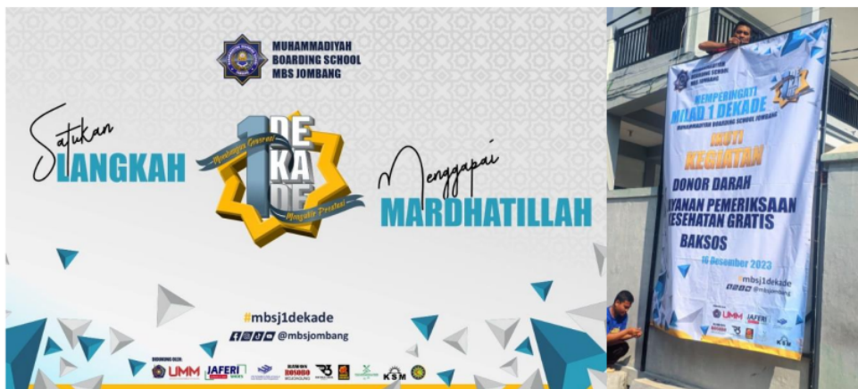
Gambar 6. Poster/banner kegiatan dan bukti dukungan tim pengabdian UMM

Tim Pengabdian UMM menjadi salah satu motor yang mendorong penyelenggaraan kegiatan ini dan menjadi salah satu sponsor (Gambar 6). Perayaan 1 DEKADE ini tidak hanya dilakukan untuk mengikuti kebiasaan, tetapi juga menjadi momen penting sebagai kesempatan untuk intropeksi, refleksi, dan juga proyeksi tentang bagaimana MBS Jombang dapat berkembang lebih jauh untuk menjadi maju dan mandiri dalam upayanya menjadikan MBS Jombang sebagai pondok pesantren kelas nasional. Setelah berdiri sekian satu dekade, kelembagaan ini telah mengalami berbagai perubahan nama, tugas, fungsi, dan peran, serta pergantian pimpinan dan staf yang terlibat. Oleh karena itu, sangat penting bagi semua pihak untuk melihat dan mempelajari kembali bagaimana MBS Jombang telah berkembang dengan pesat, serta ke mana arah pertumbuhan selanjutnya yang akan diambil. Saat ini adalah saat yang tepat bagi komunitas, pemangku kepentingan ( stake holder ), maupun masyarakat luas untuk melihat kembali MBS Jombang secara keseluruhan.