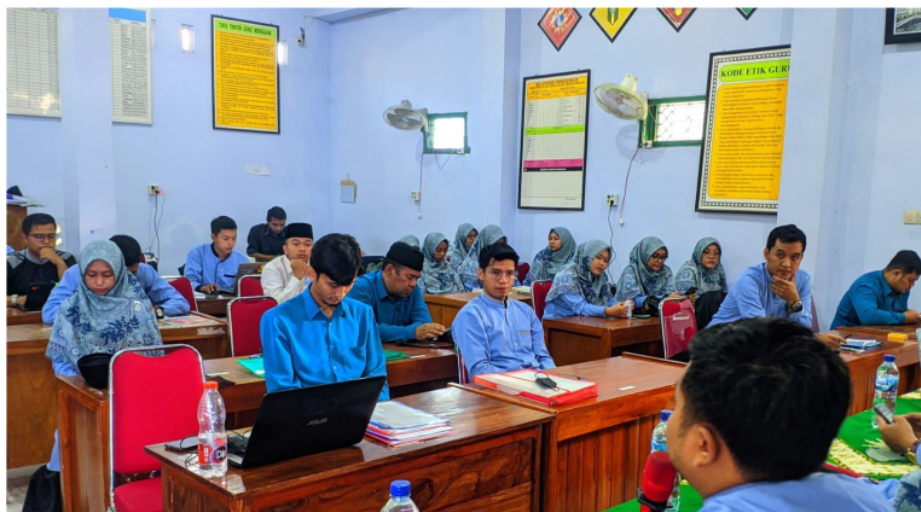
Gambar 3. Kegiatan Pendampingan Guru

Kegiatan ini dilanjutkan dengan adanya pendampingan bagi guru, baik secara luring maupun daring. Salah satu aktivitas pendampingan secara luring sebagaimana disajikan pada Gambar 3.