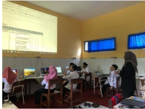
Gambar 3. Dokumentasi Pendampingan Penyusunan Asesmen Diagnostik Matematika

Berdasarkan pendampingan yang telah dilakukan, guru telah memiliki ketrampilan untuk membuat berbagai jenis soal asesmen diagnostik matematika, termasuk soal pilihan ganda, pilihan ganda kompleks, dan soal dengan jawaban singkat. Hasil penyusunan tersebut digunakan guru sebagai dasar merancang pembelajaran berdiferensiasi pada mata pelajaran matematika di SD.