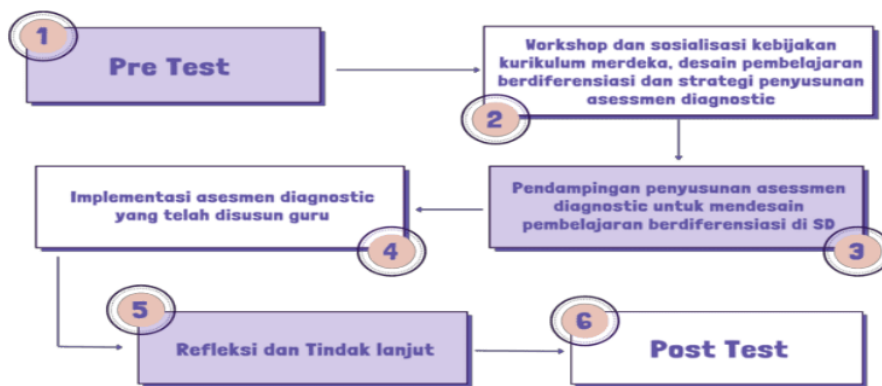
Gambar 1. Alur Pelaksanaan Kegiatan

Program ini merupakan program pengabdian kepada masyarakat Block Grant Fakultas Keguruan dan Ilmu Pendidikan Universitas Muhammadiyah Malang Tahun 2023 sesuai dengan surat tugas Nomor E.2.e/349/FKIP-UMM/VII/2023. Kegiatan ini dilaksanakan dalam kurun waktu tujuh bulan sejak Juli 2023 sampai dengan Januari 2024. Mitra yang terlibat dalam kegiatan ini yaitu sembilan guru di SDN Oro-oro Dowo Kota Malang. Metode pelaksanaan kegiatan diawali dengan pre-test, workshop dan sosialisasi, pendampingan, implementasi, refleksi dan tindak lanjut kegiatan, serta post-test. Hasil pre-test dan post-test dievaluasi untuk mengukur peningkatan kemampuan guru dalam menyusun instrumen asesmen diagnostic di SD setelah dilaksanakan pendampingan dan pelatihan oleh tim pengabdian. Adapun alur pelaksanaan kegiatan diuraikan pada Gambar 1 berikut.