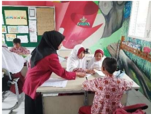
Gambar 4. Dokumentasi Implementasi Asesmen Diagnostik Matematika

Implementasi instrumen asesmen diagnostic matematika dilaksanakan pada tanggal 11 Desember 2023 pada kelas 1 SD, dengan wali kelas oleh Agung Setyo Wibowo, S.Pd. Uji coba dilaksanakan kepada 21 anak yang terdiri dari 10 siswa laki-laki dan 11 siswa perempuan. Adapun dokumentasi kegiatan implementasi ditunjukkan pada Gambar 4.