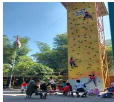
Gambar 2.Observasi pelaksanaan

Kegiatan-kegiatan yang disebutkan di atas dikuatkan oleh sudut pandang (Siyoto dan Siddiq, 2015), yang menyatakan bahwa kegiatan-kegiatan tersebut dirancang untuk membangkitkan dan memotivasi semua atlet. Pendekatan ini terdiri dari proses membangkitkan dan memotivasi semua anggota kelompok untuk menunjukkan kesediaan untuk bekerja dengan integritas untuk mencapai tujuan yang diinginkan. Pendekatan ini juga melibatkan perencanaan dan pengorganisasian oleh kepemimpinan, dengan eksekusi sebagai proses yang sangat kritis dan penting yang pada akhirnya memungkinkan pencapaian hasil dan tujuan yang diinginkan.