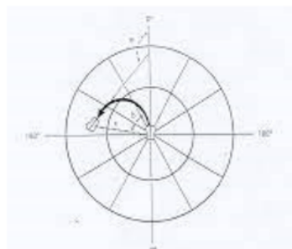
Gambar 1. Fukuda Stepping Test

Metode yang digunakan yaitu dengan memberikan arahan kepada lansia untuk melakukan test. Test ini dilakukan dengan menggunakan media seperti pada gambar. Lalu lansia di minta untuk berdiri di tengah lingkaran menghadap lurus dengan tangan di rentangkan lurus kedepan, dan mata di tutup setelah itu lansia di minta untuk melakukan jalan di tempat dengan pelan sebanyak 50 hitungan lalu amati apakah ada perubahan arah atau perpindahan tempat berdiri. Test ini dianggap tidak normal jika lansia mengalami perpindahan atau pergeseran sejauh lebih dari 1 meter dan perubahan arah lebih dari 30 derajat.