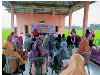
Gambar 4. Kegiatan sebelum melakukan test

Pada saat melakukan fukuda stepping test para peserta di dampingi oleh penyelenggara untuk menilai test telah dilakukan dengan benar sehingga hasil yang di dapat sesuai dengan ketentuan yang telah ditetapkan.