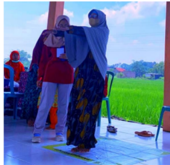
Gambar 4. Pelaksanaan test fukuda stepping

Pada saat melakukan fukuda stepping test para peserta di dampingi oleh penyelenggara untuk menilai test telah dilakukan dengan benar sehingga hasil yang di dapat sesuai dengan ketentuan yang telah ditetapkan.