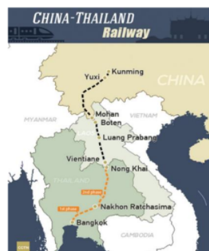
Gambar 2. Peta Konektivitas Antara Thailand Wilayah Tengah Dan Timur Melalui Proyek Kereta Cepat Bangkok-Nakhonrachasima

Tabel di atas menunjukkan bahwa populasi penduduk Thailand terbesar berada di wilayah Tengah dan wilayah Timur, yang menjadi wilayah proyek kereta cepat Bangkok-Nakhonrachasima. Besarnya populasi kedua wilayah, menjadi alasan kedua negara, dalam memilih trase Bangkok-Nakhonrachasima, dibanding Nakhonrachasima-Nong Khai. Tingkat populasi merupakan potensi sebagai konsumen kereta cepat, serta sesuai dengan kebutuhan dan kepentingan dari masing-masing pihak.