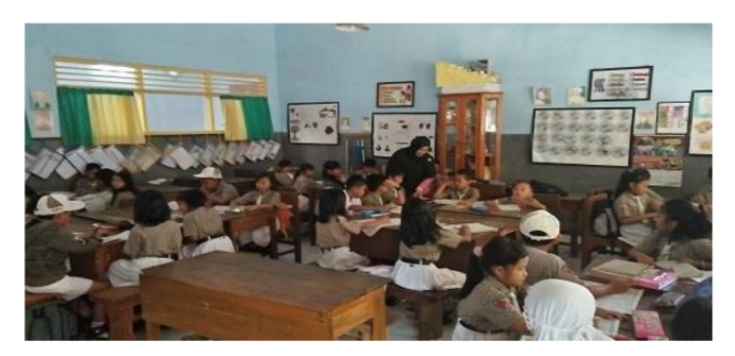
Gambar 2. KBM di SDN Girimoyo 02

Dari segi fasilitas, SD ini dapat dikategorikan baik. Sekolah ini memiliki 6 ruang kelas, ruang guru, ruang kepala sekolah, rumah dinas kepala sekolah, kantor Taman Pendidikan Al-Qur'an (TPQ), kelas ekstrakurikuler Drum band, ruang kegiatan mengaji, ruang ibadah, dan ruang perpustakaan. Ruang kelas ditata dengan baik sehingga membuat siswa nyaman dalam belajar.