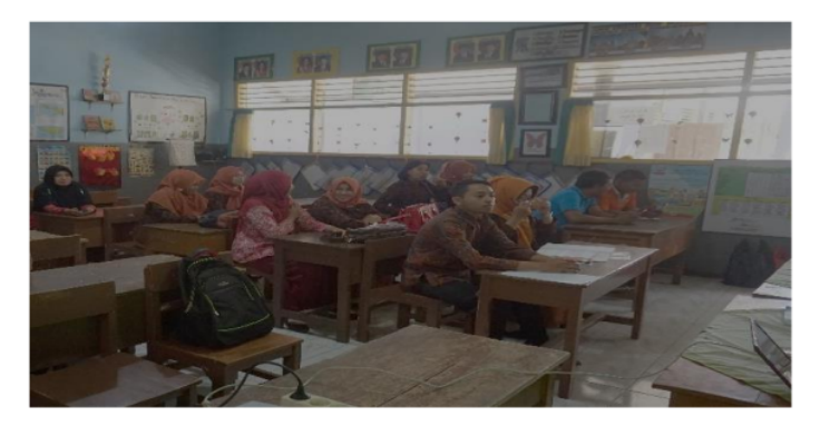
Gambar 4. Para Guru Mengikuti Pelatihan Penulisan Kreatif dengan Seksama

Pada tahap selanjutnya, kegiatan pengabdian difokuskan pada pelatihan dan pendampingan penulisan kreatif. Materi yang disampaikan berupa genre tulisan kreatif, aspek-aspek budaya lokal yang dapat dijadikan muatan dalam karya kreatif guru, dan aspek kebahasaan dalam penulisan kreatif.