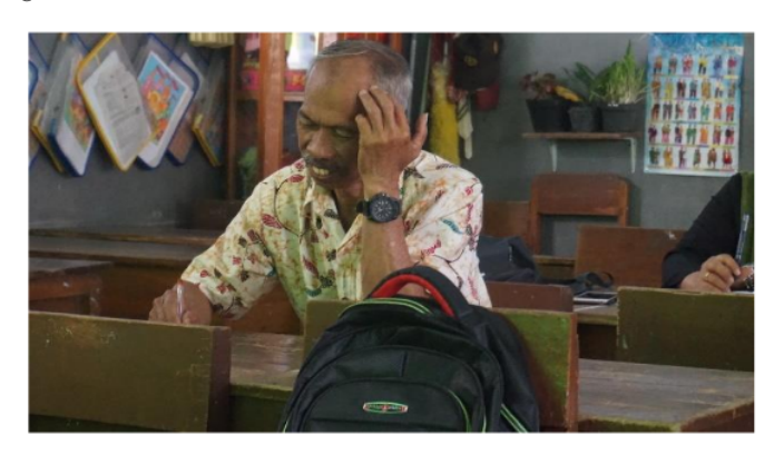
Gambar 4. Peserta Melakukan Kegiatan Brainstorming Dan Menulis Peta Konsep

Hasil kegiatan brainstorming yang telah dituangkan ke dalam peta konsep kemudian dituangkan dalam lembar kerja kerangka tulisan. Berbeda dengan kegiatan sebelumnya, pada kegiatan ini guru sudah secara detail menuliskan unsurunsur intrinsik dalam karya yang akan ditulis, terutama pada bagian alur cerita. Kerangka tulisan ini berfungsi sebagai pedoman bagi penulis dalam mengorganisasikan gagasan, mempercepat proses penulisan, menciptakan variasi tulisan yang diinginkan, dan mengoptimalkan kualitas bahasa pada tulisan (Budiyono, 2012). Dalam hal ini, tim pengabdi melakukan pendampingan secara intensif kepada guru-guru, baik pada proses penggalian ide maupun penuangan ide dalam kerangka karangan.