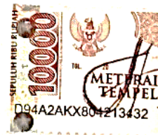
Fila Arum Sari