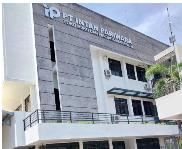
Gambar 1 Gedung PT Intan Pariwara

Gambar 1 merupakan gedung PT Penerbit Intan Pariwara yang merupakan perusahaan penerbitan buku-buku pelajaran. Selain itu, dalam bidang usaha penerbitan juga terdapat Cempaka Putih yang menerbitkan buku-buku ilmu pengetahuan sosial, sejarah, dan ekonomi.