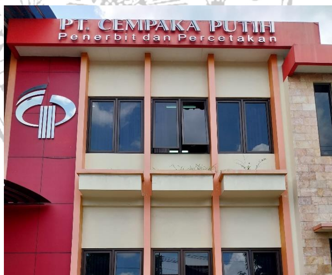
Gambar 2 Gedung Cempaka Putih

Gambar 1 merupakan gedung PT Penerbit Intan Pariwara yang merupakan perusahaan penerbitan buku-buku pelajaran. Selain itu, dalam bidang usaha penerbitan juga terdapat Cempaka Putih yang menerbitkan buku-buku ilmu pengetahuan sosial, sejarah, dan ekonomi.