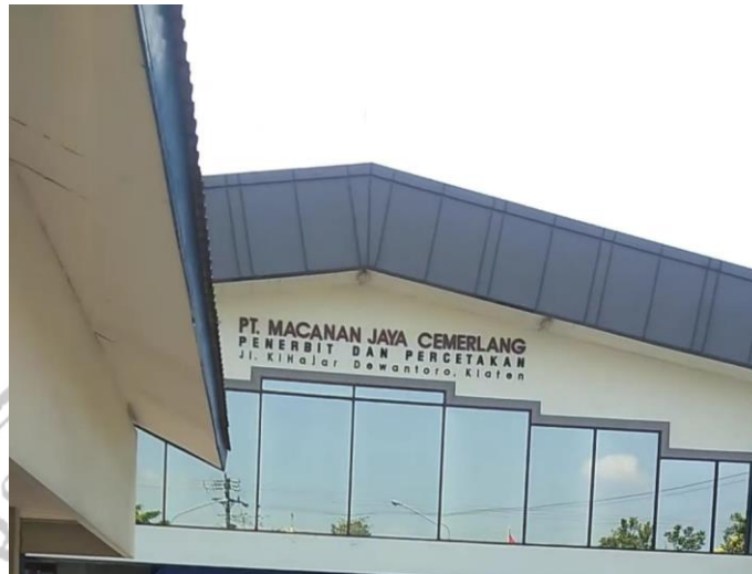
Gambar 3 PT Macanan Jaya Cemerlang

PT Intan Pariwara juga memiliki usaha percetakan yaitu PT Macanan Jaya Cemerlang yang berlokasi di Jl. Ki Hajar Dewantara tepatnya berseberangan dengan PT