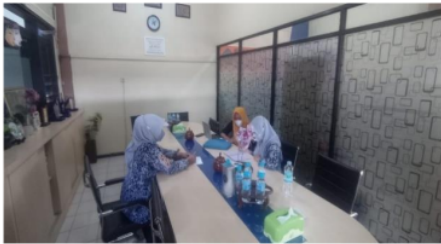
Gambar 3. Pendampingan dengan guru

Kegiatan berikutnya adalah pendampingan penyusunan modul olimpiade (Gambar 3). Kegiatan ini menghasilkan worksheet yang nantinya akan dikumpulkan menjadi modul. Setelah modul yang tersusun dari worksheet telah selesai, kegiatan dilanjutkan dengan penyusunan lembar kerja untuk siswa selama kegiatan olimpiade. Lembar kerja ini disusun oleh guru.