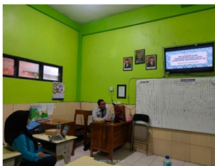
Gambar 2. Workshop olimpiade

Pelaksanaan kegiatan yang sudah dilakukan adalah kegiatan workshop untuk guru olimpiade sebanyak dua kali pertemuan (Gambar 2). Pada workshop ini tim pengabdian menyampaikan informasi tentang penyusunan instrumen untuk pendampingan olimpiade kepada siswa