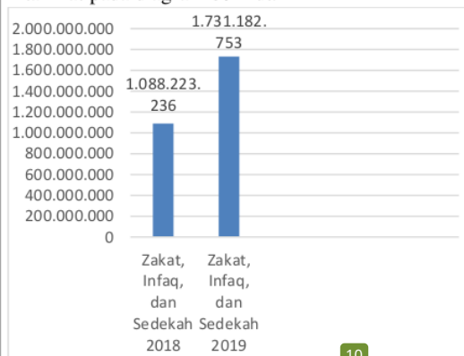
Diagram 3. Perbandingan Hasil Pengumpulan Dana Zakat, Infaq, dan Sedekah (ZIS) oleh Badan Amil Zakat (BAZNAS) Nasional Kabupaten Tanah Laut

Dari segi quantity secara keseluruhan, pada tahun 2019 motivasi kinerja Unit Pengumpulan Zakat (UPZ) yang dilakukan oleh Badan Amil Zakat Nasional (BAZNAS) Kabupaten Tanah Laut mengalami peningkatan. Hal tersebut dapat diketahui dari jumlah dana Zakat, Infaq, dan Sedekah (ZIS) yang berhasil dihimpun oleh Unit Pengumpulan Zakat (UPZ) pada tahun 2019 mencapai nilai Rp. 1.731.192.753 (ZIS) , jumlah tersebut merupakan jumlah yang melebihi hasil pengumpulan pada tahun sebelumnya yang dapat kita lihat pada diagram berikut: