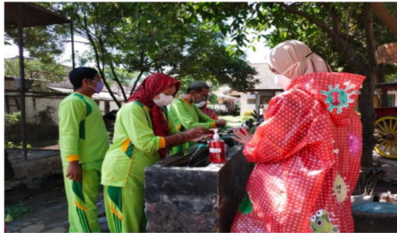
Gambar 4. Keterampilan merubah perilaku menjadi adaptif