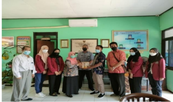
Gambar 5. Dukungan lingkungan terhadap perubahan perilaku patuh protocol covid-19

yaitu peserta diperbolehkan untuk melakukan improvisasi menyesuaikan situasi dalam pentas, dengan adanya ketentuan tersebut maka akan terlihat juga kemampuan peserta untuk merespon, berpendapat, dan menanggapi masalah terutama jika dihadapkan pada situasi pandemic yang menerapkan tatanan kehidupan baru.