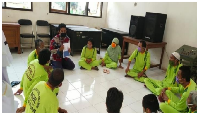
Gambar 2. Penguatan kognitif patuh protocol covid 19

Wabah Covid-19 secara resmi dinyatakan sebagai masalah kesehatan yang meluas oleh World Health Organization (WHO) pada 30 Januari 2020. Virus tersebut pertama kali dilaporkan dari Negara Cina pada bulan Desember 2019 yang hingga saat ini telah menyebar ke seluruh wilayah di Eropa, Amerika, Asia dan lain sebagainya (Lai et al., 2020). Sebagian besar masyarakat dianjurkan melakukan pembatasan sosial oleh pemerintah untuk mengurangi penularan yang sangat cepat (Pulla, 2020; Rubin & Wessely, 2020). Tidak hanya melalui program pemerintah saja, namun masyarakat juga memiliki semangat untuk terbebas dari pandemi Covid-19 melalui gotong royong (Mahardika et al., 2020). Di Indonesia hingga pada awal 2021 Pandemi Covid-19 belum mengalami penurunan secara signifikan, berdasarkan laporan Satgas Covid-19 pada tanggal 02 Februari 2021 dilaporkan jumlah pasien terkonfirmasi positif sebanyak 1.099.687 pasien sembuh sebanyak 896.530 dan pasien meninggal dunia sebanyak 30.581. Berbagai upaya dan kebijakan telah dilakukan pemerintah untuk menekan angka penularan covid-19. Penerapan kebijakan social distancing tampaknya juga berdampak pada munculnya permasalahan kesehatan mental diantaranya adanya ansietas, kehilangan kebebasan untuk beraktifitas diluar rumah, situasi yang penuh dengan ketidakpastian, arus informasi yang terlalu banyak tentang covid (Ahmed et al., 2020).