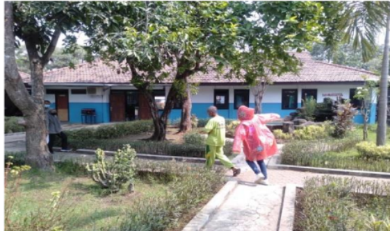
Gambar 3. Keterampilan merubah perilaku menjadi adaptif

saat menunjukkan gejala flu terdapat 28 partisipan mampu tetap berada dikamar saat terdapat gejala flu dan 52 keluar kamar saat terdapat gejala flu.