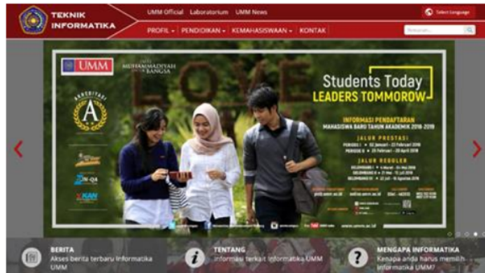
Gambar 2. Tampilan Halaman Utama Segmen Pertama

Berikut adalah contoh beberapa tampilan halaman prototype Teknik Informatika UMM yang akan di evaluasi seperti terdapat pada Gambar 2.