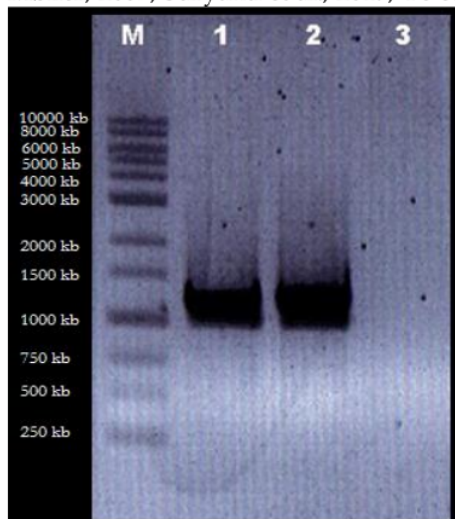
Gambar 3. Hasil optimasi annealing ketiga primer, (M) Marker 1 kb, (1) hasil amplifikasi primer pertama, (2) hasil amplifikasi primer kedua, (3) hasil amplifikasi primer ketiga

Optimasi dilakukan menggunakan PCR dengan pengaturan suhu annealing yang digunakan dihitung berdasarkan (T_m - 5) ^\circ\text{C} sampai dengan (T_m + 5) ^\circ\text{C} . Hasil optimasi ketiga primer menunjukkan primer pertama optimal pada suhu 59.5 ^\circ\text{C} , primer kedua optimal pada suhu 58 ^\circ\text{C} , primer ketiga tidak dapat ditemukan suhu optimalnya. Gambar 3 menunjukkan hasil optimasi primer menggunakan PCR, pada primer pertama dan kedua menunjukkan adanya pita DNA yang jelas, sedangkan pada primer ketiga tidak tampak adanya pita DNA. Proses optimasi annealing masing-masing primer dilakukan beberapa kali untuk mendapatkan hasil yang standard atau sama setiap pengulangan. Pada primer pertama dapat dimungkinkan lebih stabil dikarenakan memiliki GC persentase yang paling tinggi yaitu 47.62\% sehingga menunjukkan pita DNA yang jelas, hal ini dikarenakan nilai GC menunjukkan ikatan yang lebih kuat antara primer dan DNA template (Dewi et al., 2020; McPherson & Møller, 2007; Suryanti et al., 2019; Ye et al., 2012).