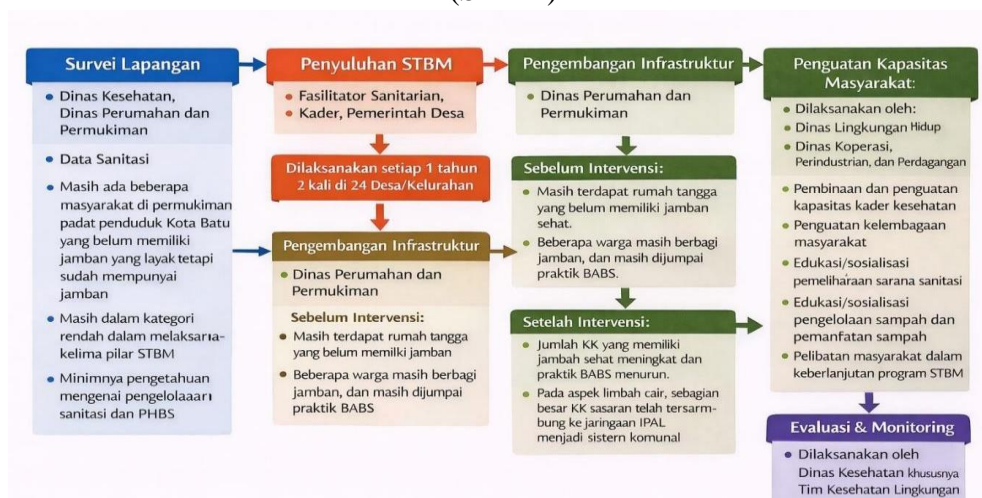
Bagan 4. 2 Tahapan Pelaksanaan Program Sanitasi Total Berbasis Masyarakat (STBM)