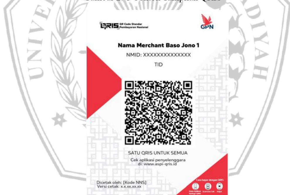
Gambar 2. 1 Contoh Tampilan QRIS