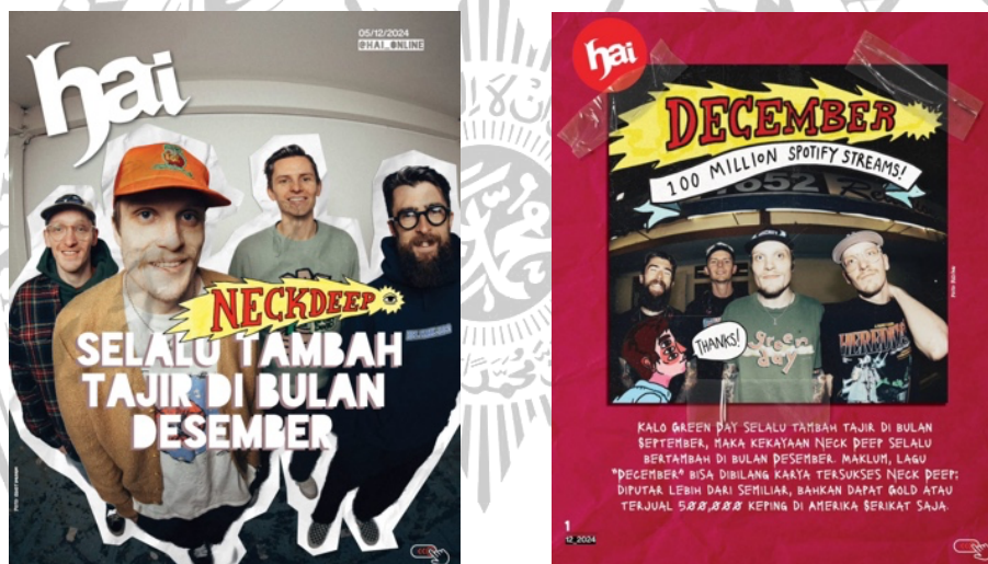
Gambar 2 Unggahan konten corousel informatif akun instagram @hai_online

Konten dalam bentuk carousel berupa visual yang memberikan informasi musik secara singkat dan jelas. Dengan menggunakan fitur ini pengguna dapat mengunggah lebih dari 1 gambar ataupun video dalam satu postingan sesuai keinginan pengguna. Fitur carousel bisa mengunggah maksimal sampai 10 slide foto maupun video, bukan hanya mempermudah tapi juga untuk menjelaskan pesan yang ada pada postingan secara terperinci.