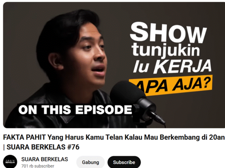
Gambar 1 Thumbnail dari episode 76

(pengikut) di YouTube dan terdapat lebih dari 100 episode dengan berbagai tema pembahasan serta narasumber atau bintang tamu yang berbeda beda.