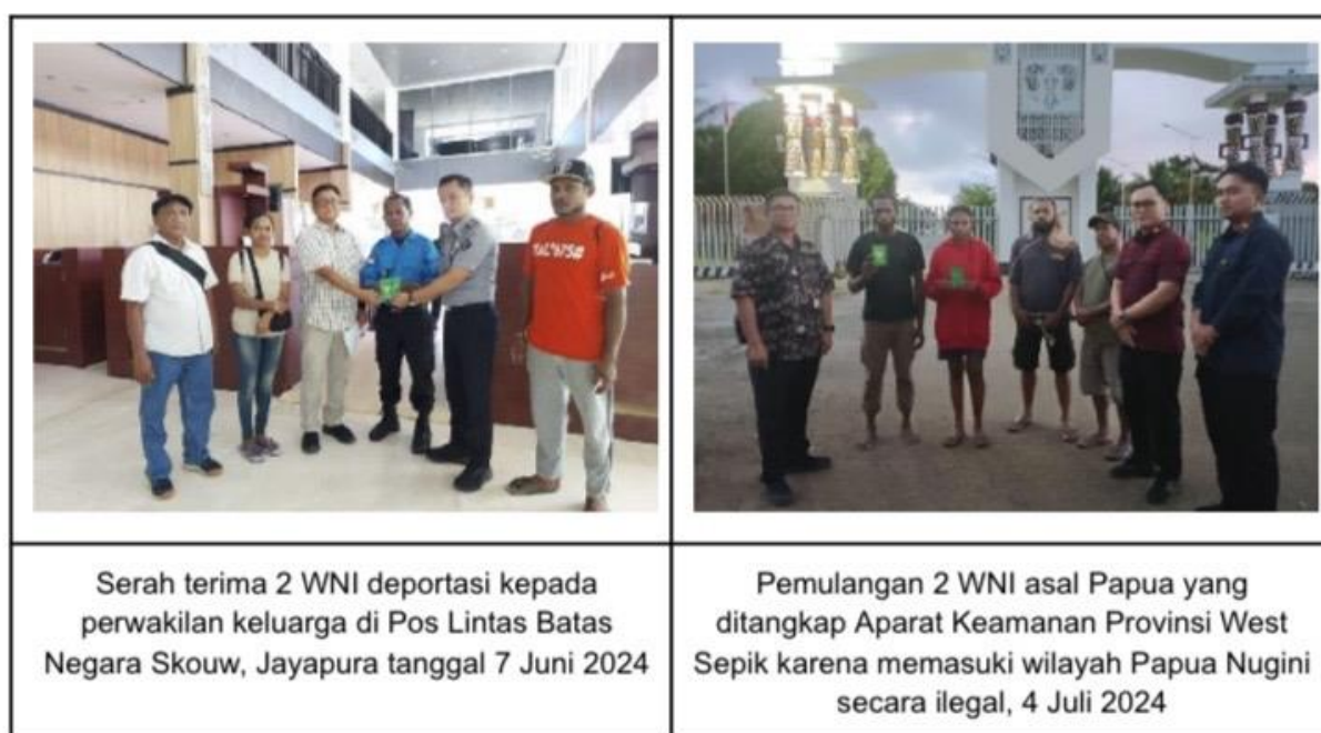
Gambar 3. 2 Deportasi WNI oleh KRI Vanimo dan Petugas Imigrasi TPI I Jayapura