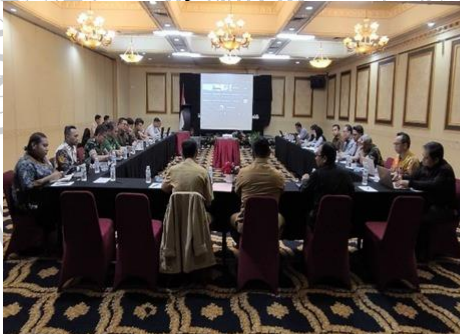
Gambar 3. 1 Forum Rapat Antara Kementerian Luar Negeri Indonesia dan Papua New Guinea