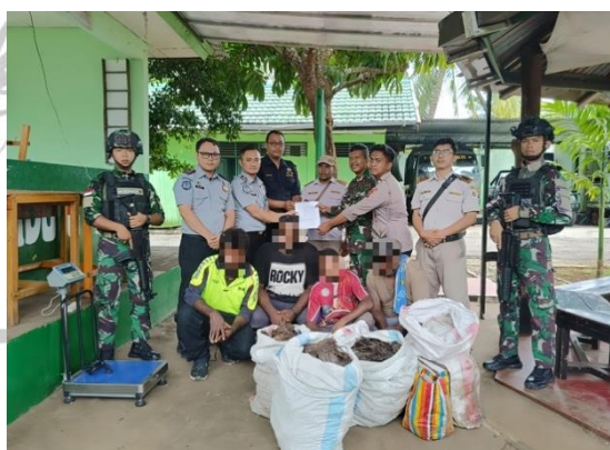
Gambar 3. 7 Bea Cukai Gagalkan Penyelundupan Vanili di Perbatasan Indonesia-PNG