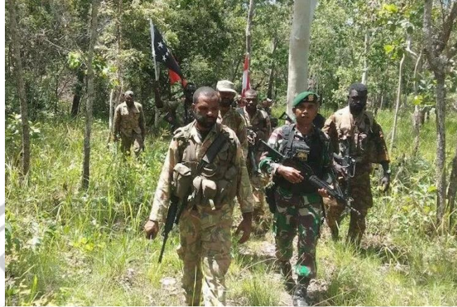
Gambar 3. 5 Patroli Patok Bersama TNI AD dan PNGDF di Perbatasan RI-PNG