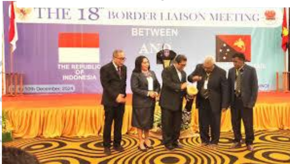
Gambar 3. 8 Provinsi Papua Selatan Tuan Rumah Border Liaison Meeting Ke-18

yang mengancam stabilitas wilayah. Keterlibatan ini menegaskan bahwa Pemda secara langsung memanggul tanggung jawab untuk mendukung kebijakan strategis nasional di wilayah perbatasan. 149