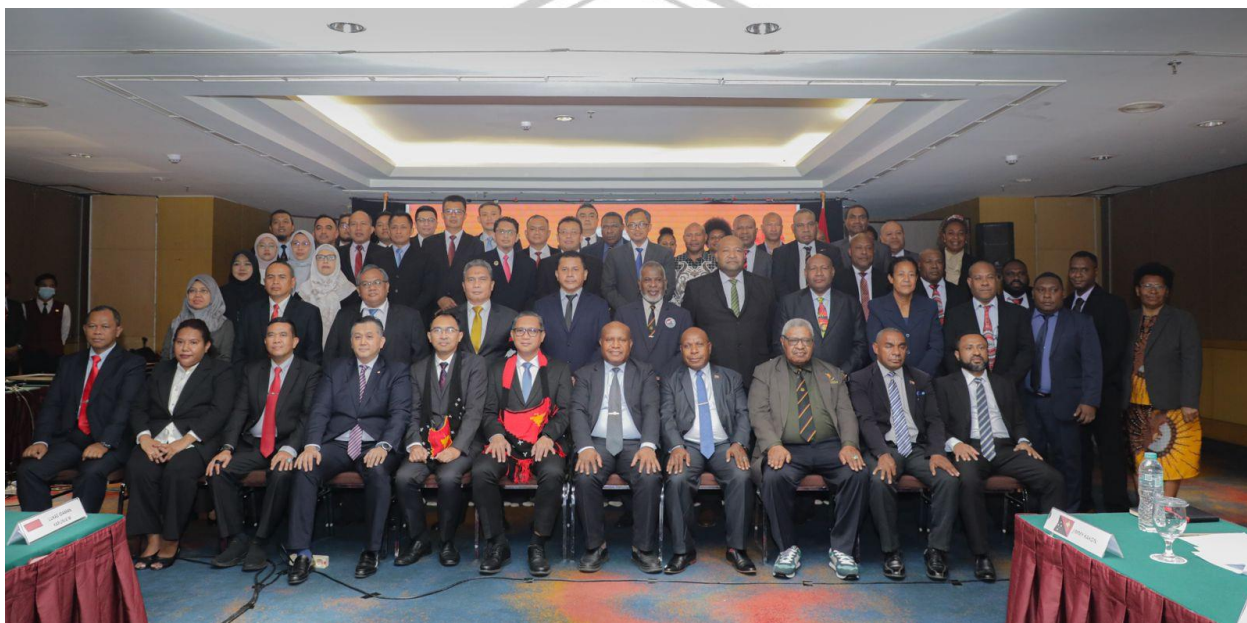
Gambar 2. 2 Rapat Forum Joint Border Commite