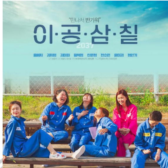
Gambar 1 Gambar 1.1 Poster Film Korea 2037