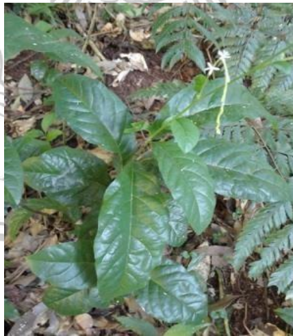
Gambar 2.1 Tanaman Singawalang (Chalk, 2021)

Kingdom : Plantae Subkingdom : Tracheobionta Superdivisi : Spermatophyta Divisi : Magnoliophyta Kelas : Magnoliopsida Subkelas : Caryophyllidae Ordo : Caryophyllales Famili : Phytolaccaceae Genus : Petiveria Spesies : Petiveria alliaceae L. (Artha et al. , 2017)