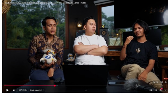
Gambar 1. 2 Podcast Allfy Rev

budaya Indonesia. Konten seperti ini bisa menjadi globalisasi budaya negara kita.