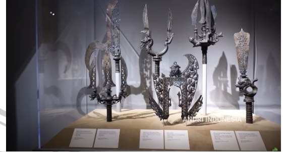
Gambar 1. 1 Pusaka Majapahit

Di era digital saat ini, identitas budaya nasional semakin penting untuk dipertahankan dan dikenalkan kembali, terutama di tengah arus globalisasi yang terus mempengaruhi cara berpikir dan berperilaku masyarakat. Budaya asing begitu mudah diakses dan dikonsumsi oleh masyarakat Indonesia melalui media sosial, sehingga upaya untuk memperkuat kembali jati diri bangsa menjadi urgensi yang tidak dapat diabaikan. Salah satu cara efektif untuk mengenalkan identitas budaya Indonesia adalah melalui media audiovisual yang dikemas secara kreatif dan menarik.