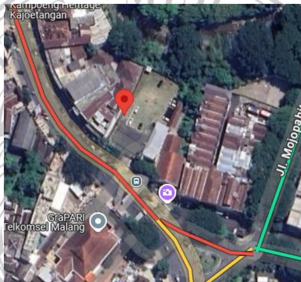
Gambar 2.1 Lokasi Perencanaan Gedung Parkir

Gedung Parkir yang direncanakan di dekat kawasan Kayutangan Heritage yang terletak di koordinat 112^{\circ}630' (BT) dan 7^{\circ}979' (LS). Perencanaan dilakukan pada area seluas \pm 1942 \text{ m}^2 . Letak perencanaan Gedung Parkir ditunjukkan pada Gambar 2.1.