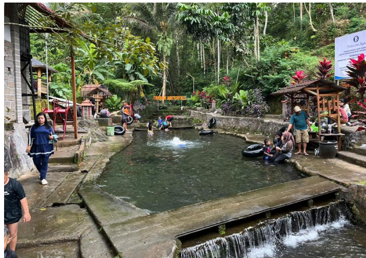
Gambar 1. Pariwisata Tanaka Waterfall