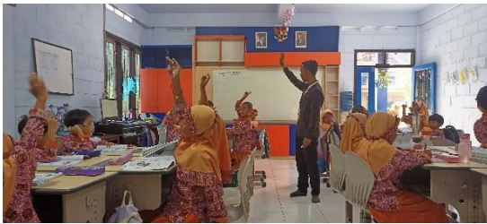
Gambar 2 Penataan ruang kelas 2B yang menarik

Berdasarkan hasil wawancara dengan narasumber, guru kelas 2 telah melakukan analisis lingkungan sekitar guna menunjang proses pembelajaran yang sesuai dan memberikan rasa nyaman kepada peserta didik.