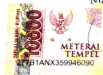
Untung Fadjar Muhammad