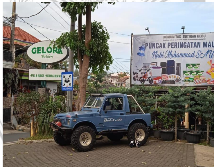
Gambar 3. 3 Jeep Gelora Adventure

Dalam perkembangannya, Gelora Adventure seringkali dikaitkan dengan Gelora Garden, yaitu kafe dan restoran yang berada di lokasi yang sama dan juga merupakan usaha milik pribadi masyarakat. Keberadaan Gelora Garden berfungsi sebagai fasilitas pendukung bagi wisatawan jeep, seperti titik keberangkatan dan pemberhentian wisata, tempat istirahat, area berkumpul wisatawan, serta ruang konsumsi setelah kegiatan petualangan berlangsung. Integrasi antara layanan wisata jeep dan usaha kuliner ini memperlihatkan bagaimana inisiatif individu masyarakat mampu menciptakan ekosistem wisata yang saling mendukung, sekaligus memperluas peluang ekonomi lokal melalui pengembangan usaha turunan pariwisata.