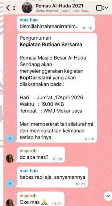
Gambar 1. 3 Koordinasi Kegiatan Melalui Grup WhatsApp

Nilai-nilai religius dan keterikatan terhadap masjid ini kini mengalami dinamika baru seiring dengan masuknya teknologi digital dalam aktivitas komunikasi mereka. Fenomena dari penggunaan media sosial itu sendiri khususnya WhatsApp, telah menjadi bagian yang tidak terpisahkan dari dinamika kehidupan remaja di Desa Sendang, termasuk para remaja Masjid Al-Huda. Berdasarkan hasil pengamatan awal di lingkungan tersebut, ditemukan bahwa tingginya aktivitas remaja dalam menggunakan grup WhatsApp tidak lantas membuat mereka menarik diri dari lingkungan sosialnya di dunia nyata. Sebaliknya, penggunaan grup WhatsApp yang intens justru berfungsi sebagai media utama untuk mengoordinasikan berbagai kegiatan, berbagi informasi, serta menjaga keberlanjutan komunikasi di luar jam pertemuan rutin masjid. Pola komunikasi digital yang aktif ini menciptakan kedekatan emosional dan rasa saling membutuhkan informasi, yang pada akhirnya menjadi stimulan kuat bagi para remaja untuk melakukan pertemuan fisik.