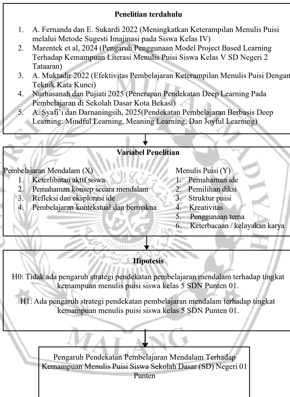
Tabel 2. 3 Kerangka berpikir

Kerangka pikir penelitian ini dapat digambarkan dalam bagan sebagai berikut: