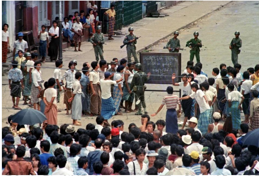
Gambar 2.1 Kondisi demonstrasi saat revolusi 8888 di Yangon (1988)