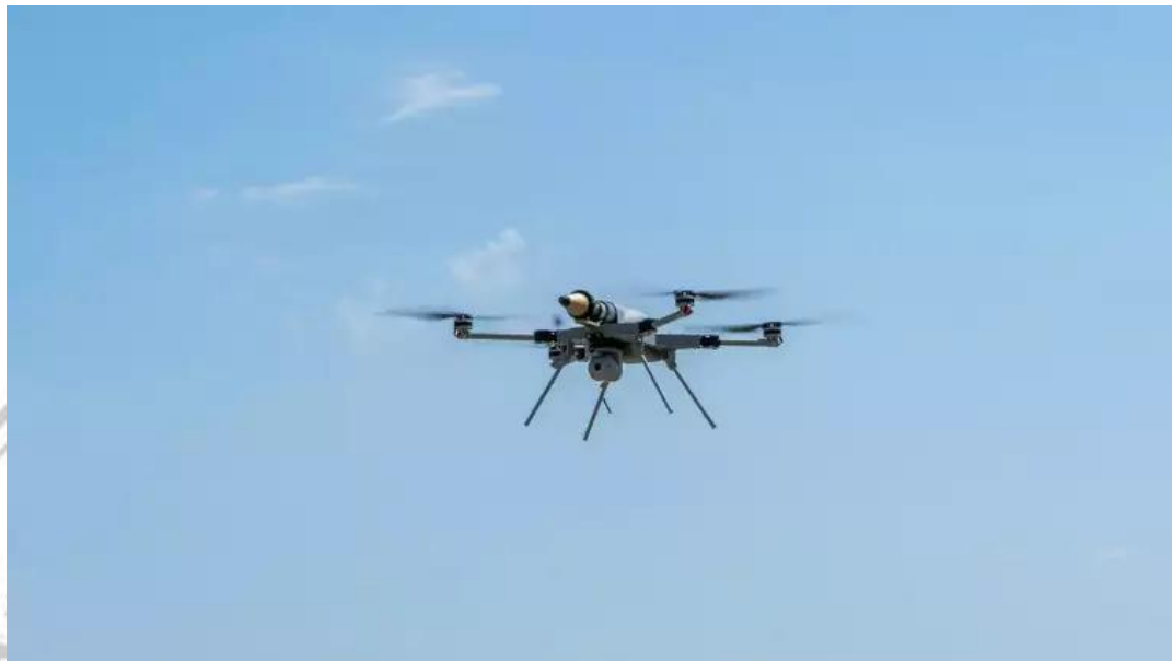
Gambar 3 Drone Kamikaze KARGU buatan STM Turkiye dengan Hulu Ledak Penembus Lapis Baja.

musuh, menghancurkan post/infrastruktur di bahkan bisa untuk melumpuhkan alusista musuh dengan cara menabrakkan drone ini.