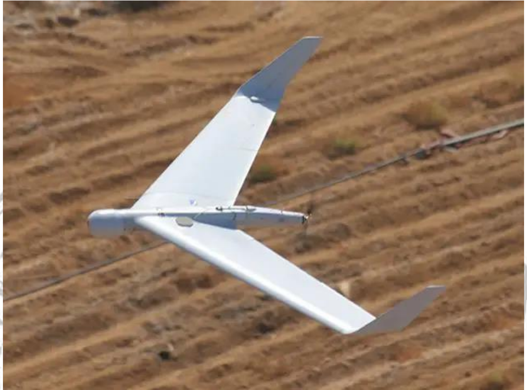
Gambar 6 UAV Orbiter.

cepat dan efisien, memastikan keandalan dan kinerja luar biasa untuk skenario misi yang diperlukan 109 .