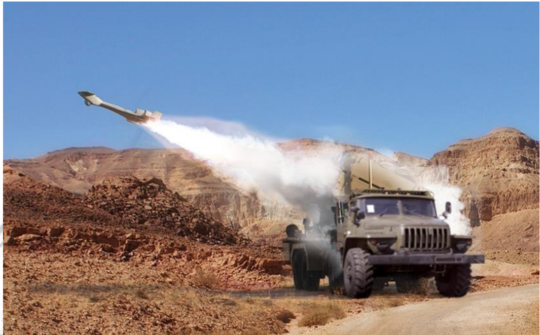
Gambar 5 Peluncuran HAROP Drone.

diperlukan. Diluncurkan dari tabung yang dipasang pada truk atau kapal perang, HAROP dapat dengan mudah dioperasikan dari berbagai medan dan lingkungan.