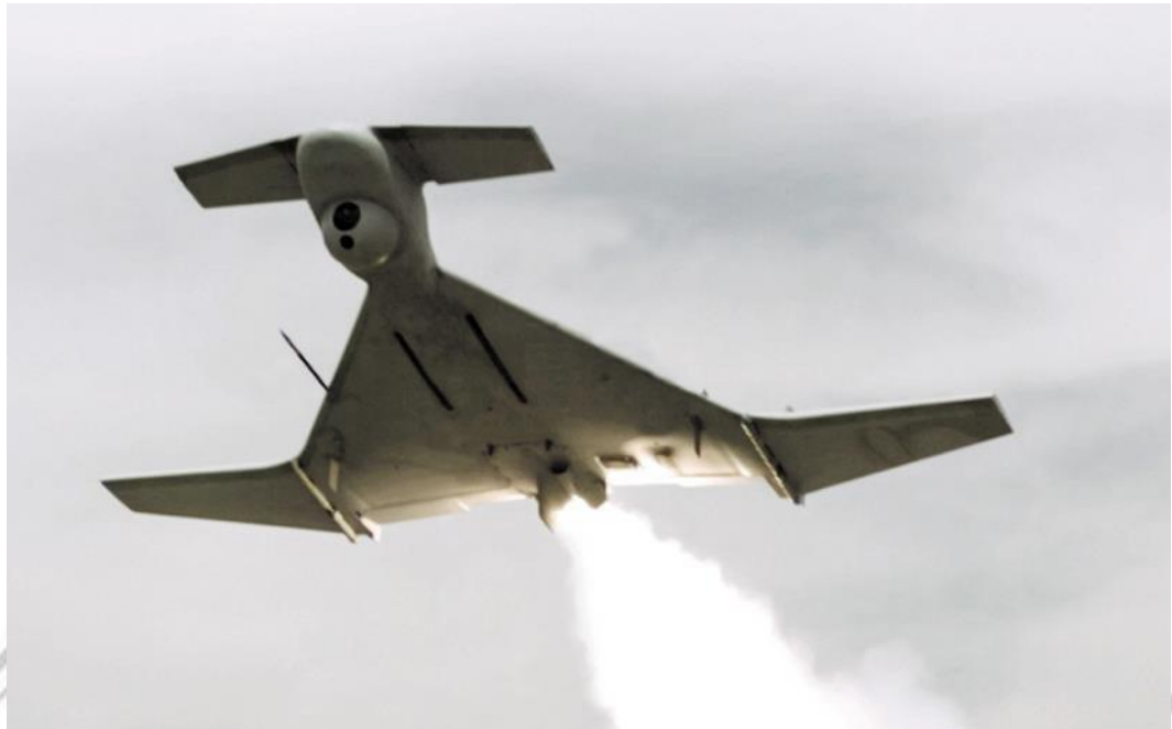
Gambar 4 Drone HAROP.

Harop adalah drone yang menggabungkan karakteristik pesawat tak berawak (UAV) dan rudal, HAROP tetap menjadi senjata loitering yang tangguh, dilengkapi untuk memburu target bernilai tinggi seperti kapal permukaan tak berawak, pos komando, gudang pasokan, tank, dan sistem pertahanan udara. Menggunakan pencari elektro-optiknya dan tanpa informasi intelijen sebelumnya, HAROP memiliki daya tahan 9 jam untuk mencari sasaran di area yang ditentukan, mengidentifikasi dan melacaknya, merencanakan rute serangan, lalu melancarkan serangan dari arah mana pun dengan sudut terjun dangkal atau curam. HAROP mengatasi tantangan komunikasi dengan kekebalannya terhadap gangguan Global Navigation Satellite System (GNSS) 108 . Sebagai sistem senjata terarah, HAROP diawasi oleh kontrol misi manusia dalam loop jarak jauh dan dapat dibatalkan jika