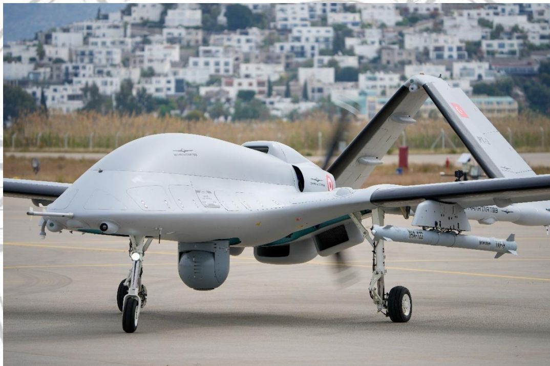
Gambar 2 Bayraktar TB3.

tetapi Drone ini juga bisa digunakan untuk menyerang dengan dipersenjatai Air to Ground missile (AGM) yang bisa digunakan untuk Menghancurkan Tank dan alusista musuh lainnya. Tetapi jika Drone ini dipersenjatai kemungkinan besar mudah untuk terdeteksi oleh musuh karena Drone tersebut mengangkut Rudalnya di luar bagian sayap. Maka oleh karena itu Azerbaijan lebih sering menggunakan Drone ini untuk kepentingan Operasi Pengintaian.