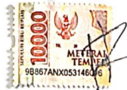
Rahmad Hafidz Pomalingo