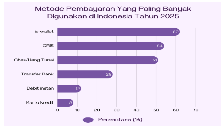
Gambar 1. 3 Metode Pembayaran yang Paling Banyak Digunakan di Indonesia Tahun 2025