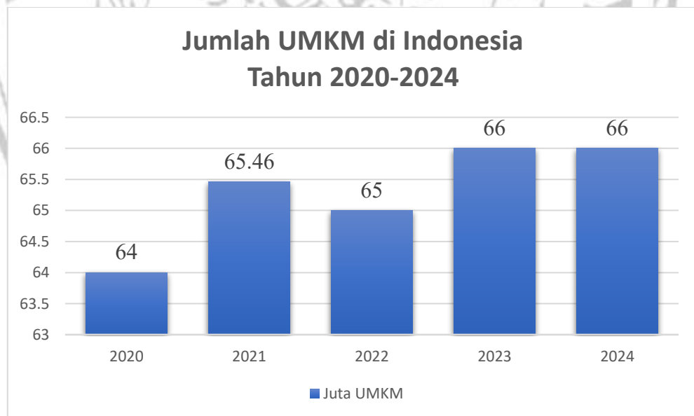
Gambar 1. 1 Jumlah UMKM di Indonesia Tahun 2020-2024

UMKM memiliki peran penting dalam pembangunan dan pertumbuhan ekonomi. Di Indonesia, UMKM memiliki kontribusi besar dalam mendorong laju pendapatan ekonomi daerah maupun negara dan membuka lapangan pekerjaan bagi masyarakat. Pada tahun 2018 (1) menerbitkan data yang menyatakan bahwa Usaha Mikro, Kecil dan Menengah (UMKM) di Indonesia memiliki proporsi sebesar 99,99% dari total keseluruhan pelaku usaha. Definisi dari UMKM adalah kelompok usaha yang terdiri dari Usaha Mikro, Usaha Kecil, dan Usaha Menengah yang berdiri sendiri dan dimiliki oleh perorangan atau badan usaha yang dibedakan berdasarkan skala usaha, jumlah kekayaan dan pendapatan tertentu (2).