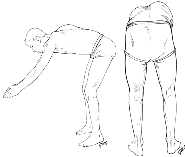
Gambar 2.3 Pemeriksaan Adams Forward Bending Test (Horne et al., 2014)