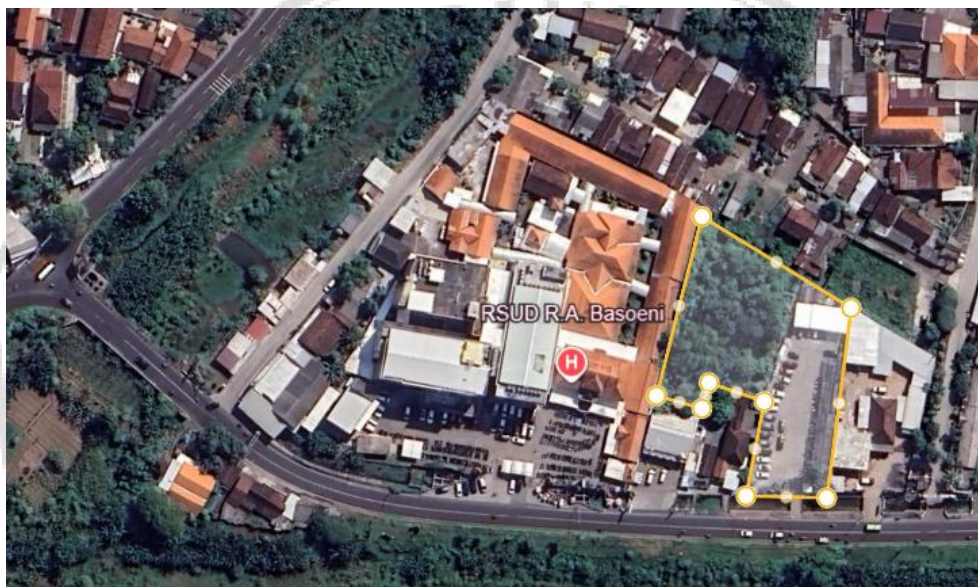
Gambar 2. 1 Peta Lokasi Proyek

Kabupaten Mojokerto ada di Provinsi Jawa Timur. Keseluruhan wilayah memiliki luas 969,4 km 2 dengan posisinya yaitu di antara 7°18'35" s/d 7°47" LS serta 111°20'13" s/d 111°40'47" BT. Dari segi administratif mencakup 304 desa dengan sejumlah 18 kecamatan.